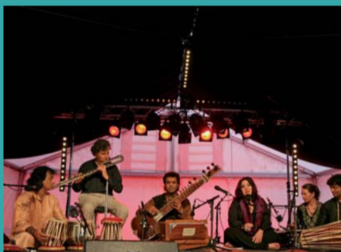
entre la rose et le jasmin