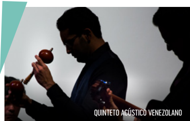
QUINTETO ACÚSTICO VENEZOLANO