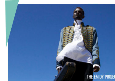
THE EMIDY PROJECT